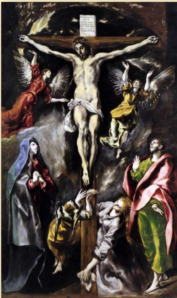
El Greco – 1596-1600 Museo del Prado, Madrid